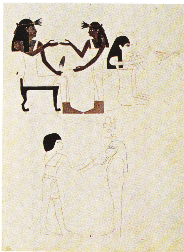
Wensu og hans hustru i en offerscene. Hay Add. MSS 29822,35. Ill. for oven. – Udsnit af gæstebud og begravelsesritual. Burton Add. MSS 25638,48. Ill. til højre (The British Library, London).