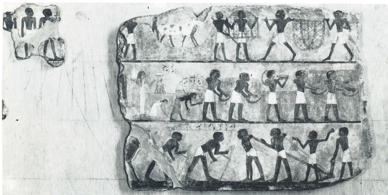
Udsnit af landbrugsscenen. Louvre N 1431 (Musée National du Louvre, Paris).